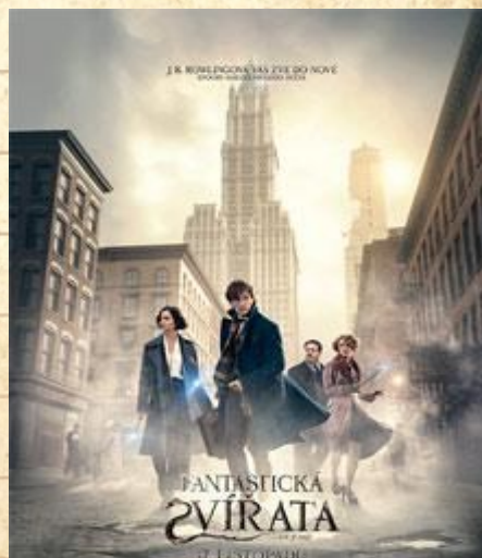
FOTO: Premiere Cinemas. (2016). Fantastická zvířata a kde je najít.

Jestli vás zajímá, co se v New Yorku stalo, a chcete vědět více o kouzelných zvířatech a kouzlech, doporučuji, abyste se na tento film zašli do kina podívat.